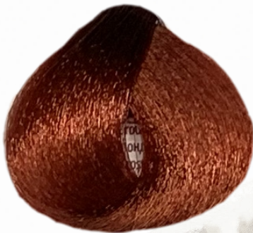
7/6 biondo rosso