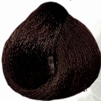
5/5 castano chiaro mogano