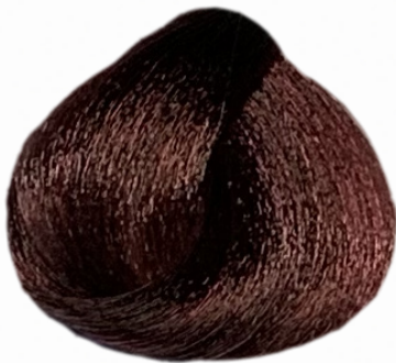
5/6 castano chiaro rosso