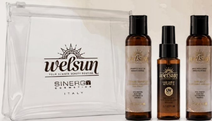
2026 TRAVEL KIT